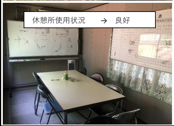
休憩所使用状況 → 良好