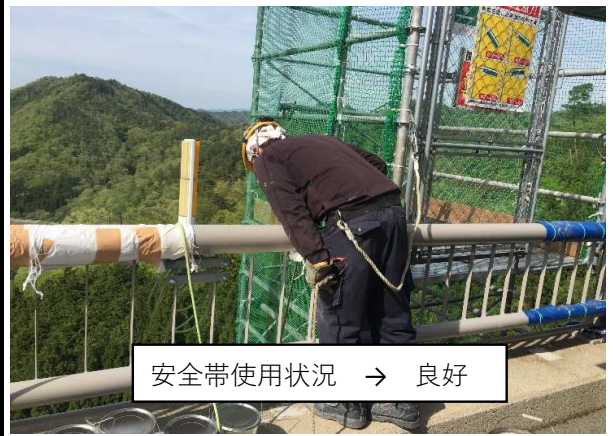
安全帯使用状況 → 良好